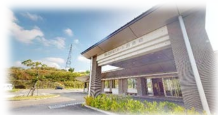
特別養護老人ホーム灘海園