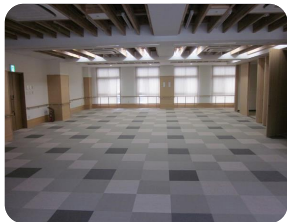
交流・リハビリ室(2F)