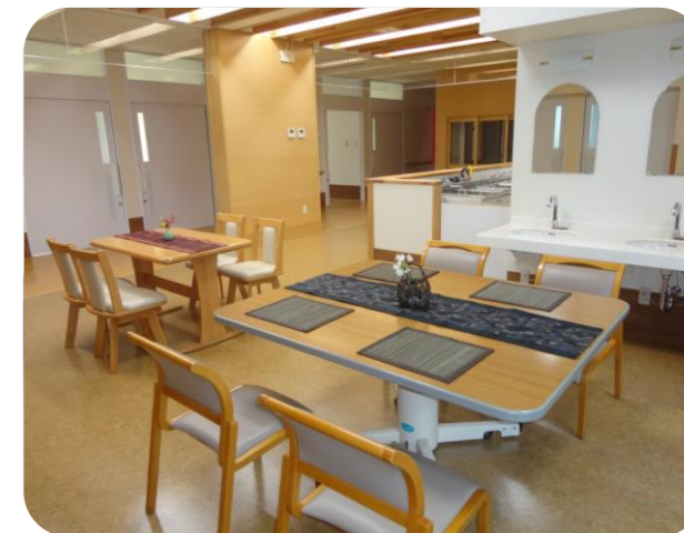
各ユニットに共同生活室があります