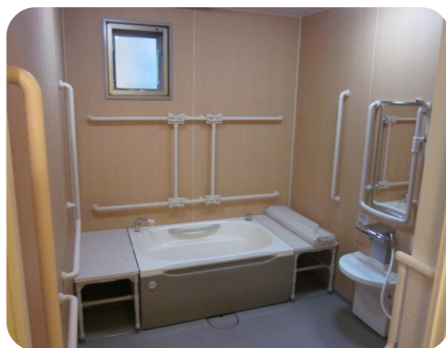
各ユニットに個浴があります

介護保険に基づき、要介護度によって利用料(介護報酬の1割～3割負担)を定めています。また、これと別に、1日当たり食費(1,380円)と居住費(短期入所の場合は滞在費)(1,970円)をご負担いただくことになります。詳しくは、当園へお問い合わせ下さい。利用料については、世帯の所得などに応じて負担軽減措置がありますので、各市町村窓口にお尋ね下さい。