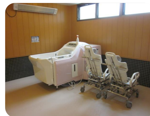
チェアインバス(2・3F)