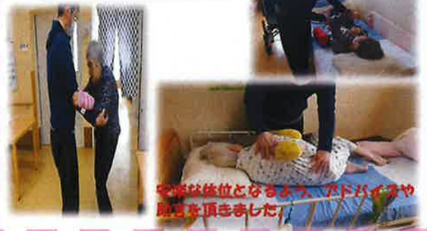
安楽な体位となるよう、パッドパイプや肘当てを頂きました。