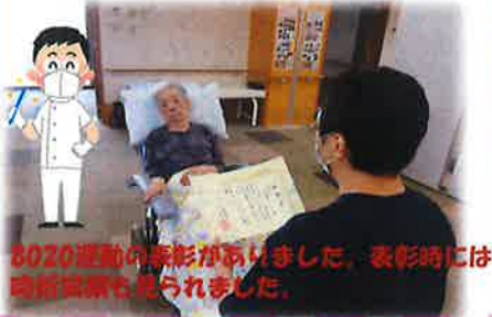
8020運動の表彰がありました。表彰時には時給賞状も授けられました。