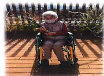
屋上庭園 五ねぎの収穫祭