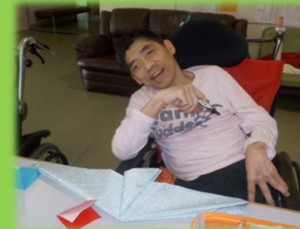
南棟：鯉のぼり作り 手作りの兜をかぶってハイ、ポーズ!