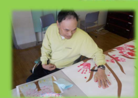
北棟：壁画 手形をとって桜の木を作りました!