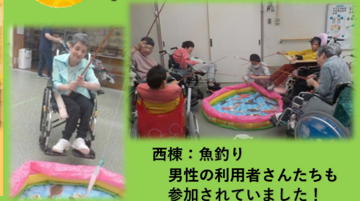
西棟：魚釣り 男性の利用者さんたちも参加されていました!