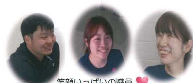
笑顔いっぱいの職員❤️ 新しい施設でも頑張ります。